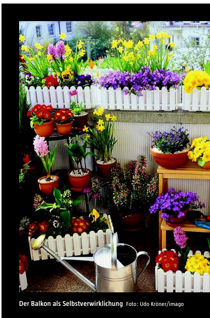
Der Balkon als Selbstverwirklichung

VIelfalt Für die eine ist der Balkon Therapie. Andere gehen aufs Dach. Und ein paar Studenten suchen den Dschungel in der Großstadt