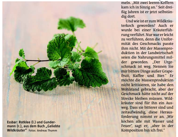
Essbar: Rotklee (l.) und Gundermann (r.), aus dem Buch „Geliebte Wildkräuter“