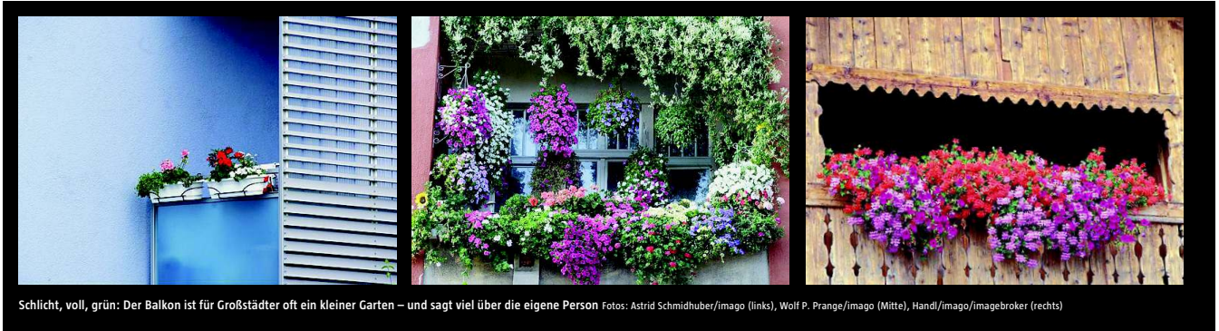
Schlicht, voll, grün: Der Balkon ist für Großstädter oft ein kleiner Garten – und sagt viel über die eigene Person